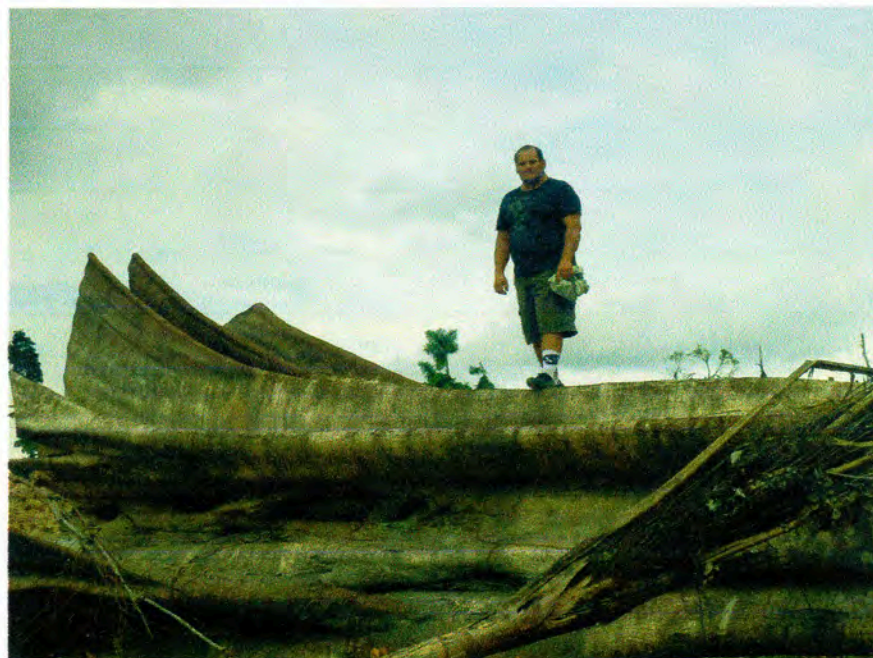
FOTO 10: QUEBRADA BOAYO, DESVÍO DE CURSO POR LA EMPRESA PLANTACIONES DE UCAYALI EN EL CASERÍO BAJO RAYAL – NUEVA REQUENA – CORONEL PORTILLO – UCAYALI