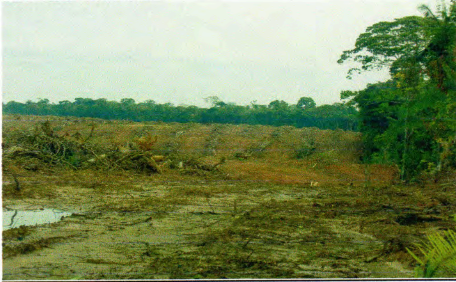
FOTO 8: DEFORESTACIÓN EN EL CASERÍO BAJO RAYAL – NUEVA REQUENA – CORONEL PORTILLO – UCAYALI