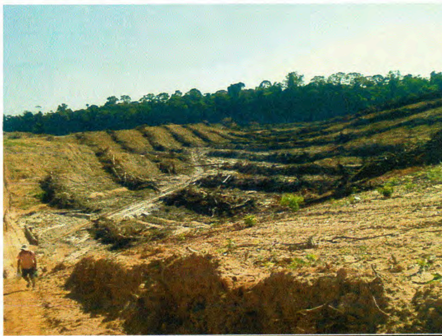
FOTO 2: DEFORESTACIÓN EN EL CASERÍO BAJO RAYAL – NUEVA REQUENA – CORONEL PORTILLO – UCAYALI