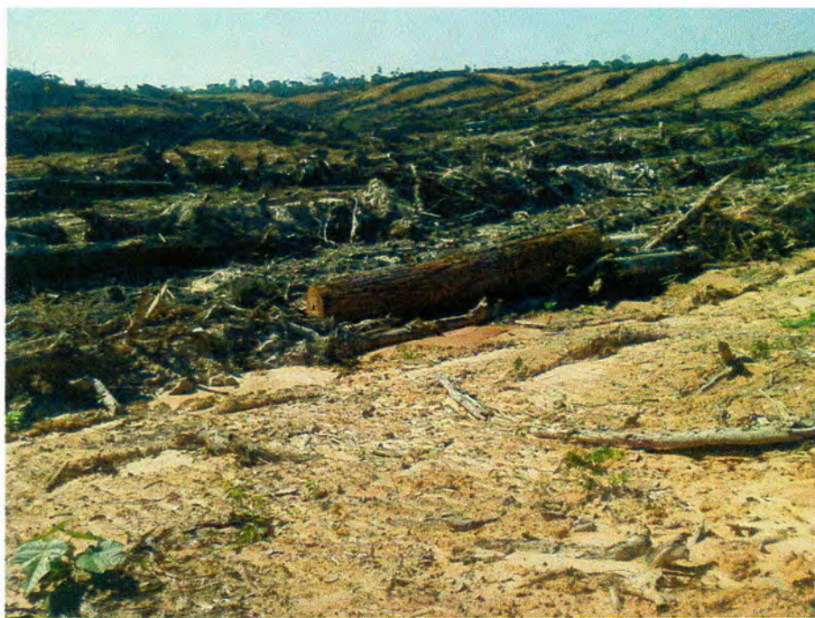
FOTO 4: DEFORESTACIÓN EN EL CASERÍO BAJO RAYAL – NUEVA REQUENA – CORONEL PORTILLO – UCAYALI