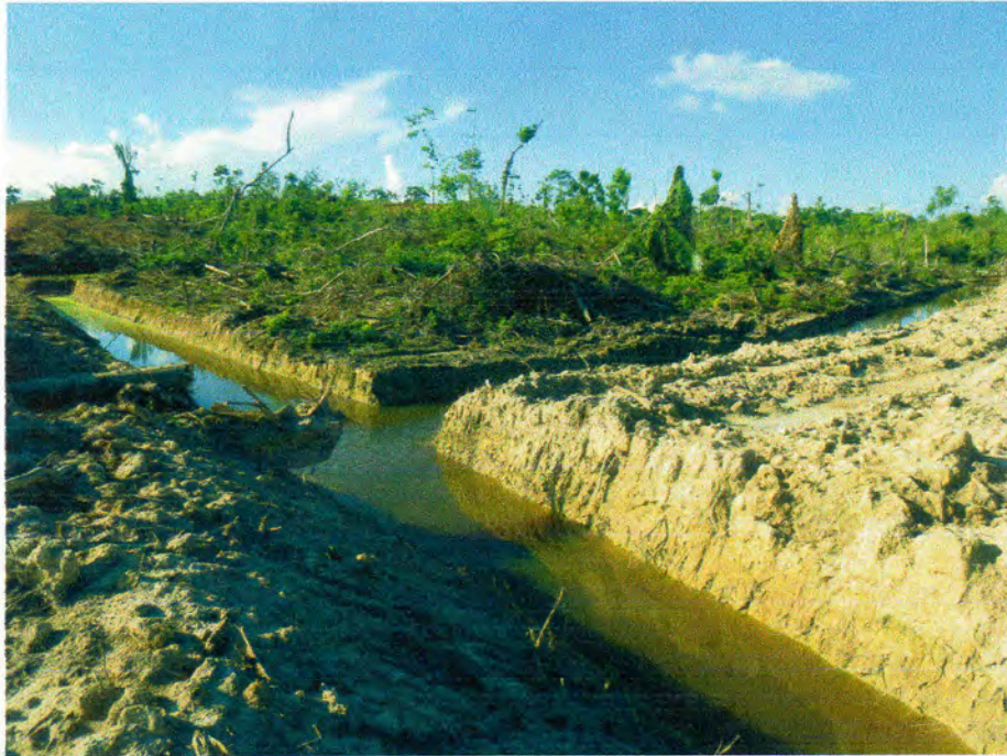
FOTO 12: QUEBRADA BOAYO, DESVÍO DE CURSO POR LA EMPRESA PLANTACIONES DE UCAYALI EN EL CASERÍO BAJO RAYAL – NUEVA REQUENA – CORONEL PORTILLO – UCAYALI